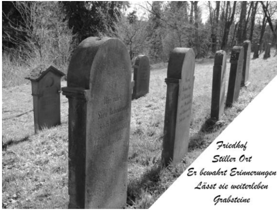
Friedhof Stiller Ort Er bewahrt Erinnerungen Lässt sie weiterleben Grabsteine